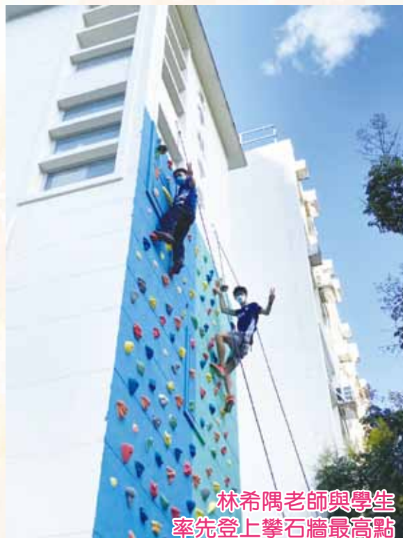
林希隅老師與學生 率先登上攀石牆最高點