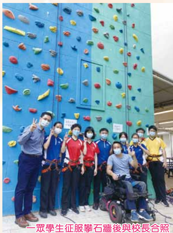
一眾學生征服攀石牆後與校長合照