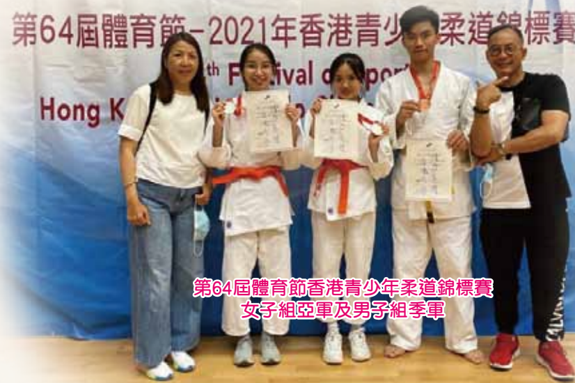
第64屆體育節香港青少年柔道錦標賽 女子組亞軍及男子組季軍