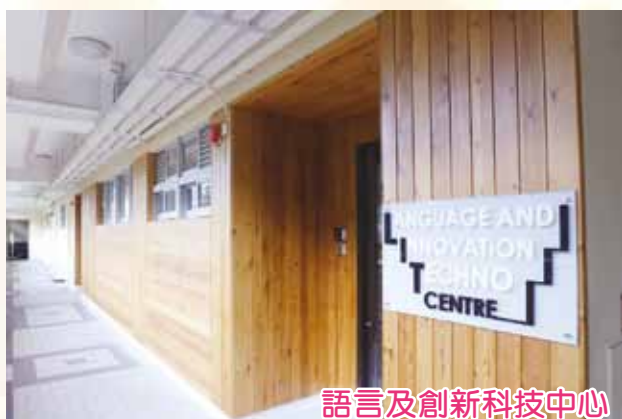
語言及創新科技中心