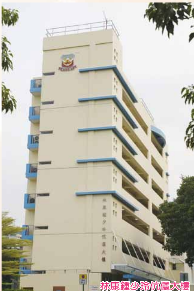
林康鍾少玲仝麗大樓