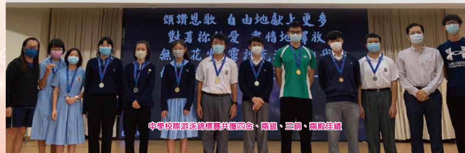
中學校際游泳錦標賽共獲四金、兩銀、三銅、兩殿佳績